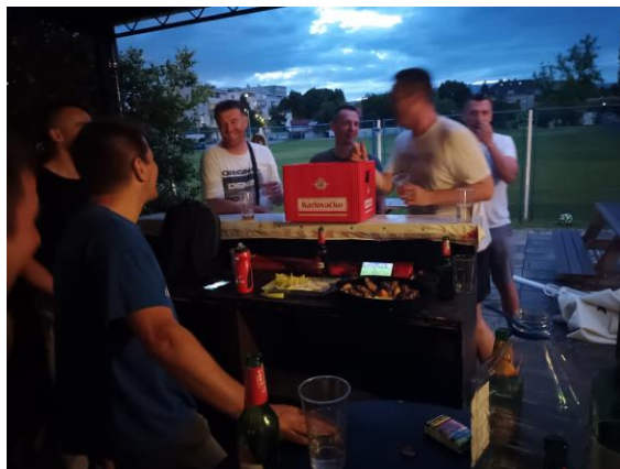
Djelić atmosfere nakon utakmice